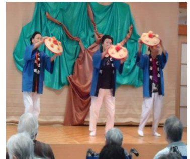
ヤッショ マカシヨ

利用者の皆さんからは、「芸能人顔負けの唄や踊りで、とってもよかったよ。」との感想が聞かれ、楽しいひとときとなりました。