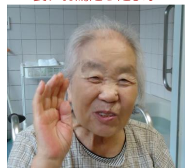
良いお湯だったよ♪