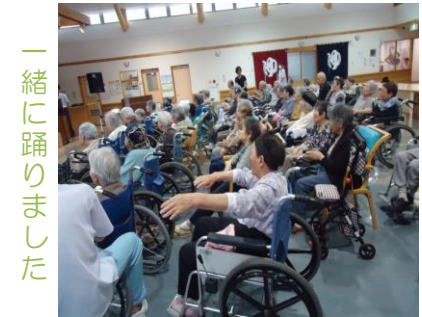
一緒に踊りました