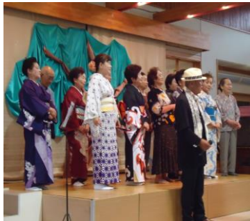
こだま会の皆さん