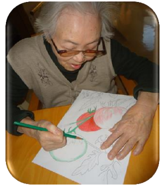
ここは、緑色にしましょ♪