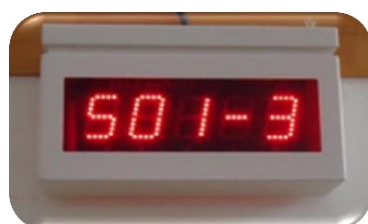
廊下に設置したデジタル表示器