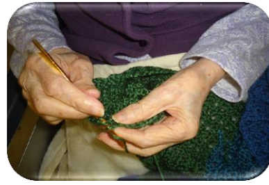
編み物って楽しいわね♪