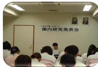
研究の成果を発表

1月20日（水）、園内研究発表会を開催しました。各所属から日頃の研究の成果が発表され、職員は熱心に耳を傾けていました。これからも、職員の資質の向上に努めてまいります。