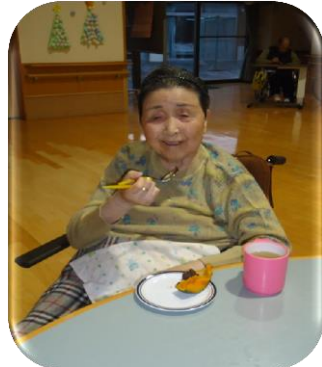
冬至カボチャで風邪知らず！