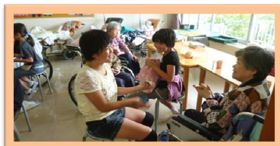
また遊びに来てね！

7月7日（火）郡山市立熱海小学校の児童23名が来園して主に昔遊び（お手玉、あやとり等）で交流いたしました。