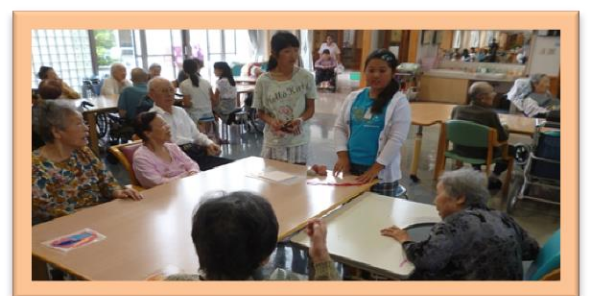
私たち熱海小学校から来ました