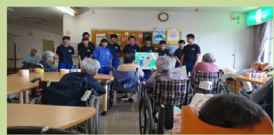
昔懐かしい紙芝居の披露

7月2日（木）3日（金）郡山市立熱海中学校の3年生の生徒さん11名が来園し、環境整備やミニ発表会をして楽しく交流し