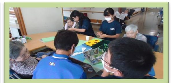
壁飾り（ひまわり）を作成中