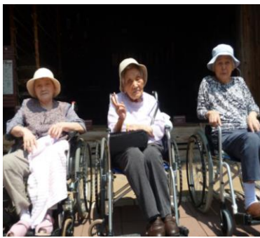
野口英世の生家前で☆