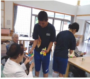
折り紙の作品をプレゼント