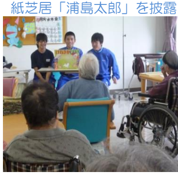
紙芝居「浦島太郎」を披露

6月27日と28日の2日間、熱海中学校の生徒さんが福祉体験学習のため来園され、奉仕活動や余暇活動を通して、利用者の皆さんとの交流を深めました。