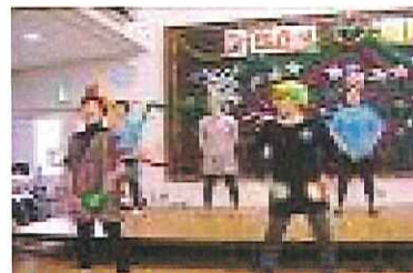
やきとりじいさん体操