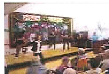
ダンス(エグザイル)