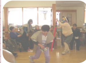
職員が扮した鬼へ元気に豆を投げつけ、無病息災を願いました。「鬼は～外」「福は～内」