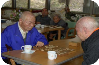
対局「宜しくお願いします。」