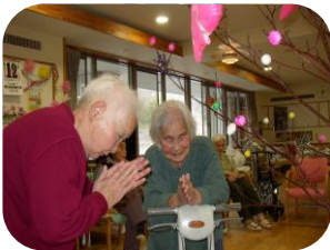
今年もセンターでミズキの木に一人ひとり願いを込めながら団子やお飾りを飾りました。