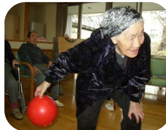
ねらってねらって