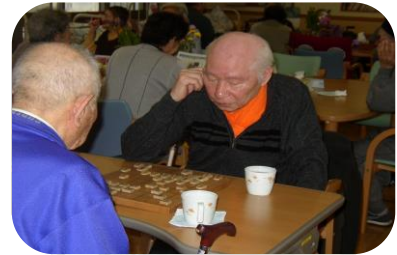
なかなか やるなあ～

以前の職業は板前さんと呉服屋さん。今は同じ土俵の上で熱き戦いを繰り広げています。この日は、互角の戦いにて結局決着が付かず、また次回へ持ち越し！！