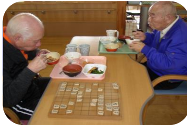
一時休戦し和やかに！？昼食を