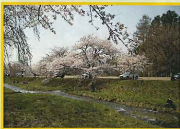
川桁 観音寺川の桜並木

太田小磯デイサービスセンター、今年度初めての行事は、川桁方面へ観音寺川の桜まつりに出かけました。観音寺川桜まつり実行委員会のご好意で車窓から眺められるようにしていただき、利用者の方々も目の前に広がる桜並木に大興奮、帰りの車の中では唄も飛び出すほどで、「とても楽しい花見だった。」と喜んでおられました。