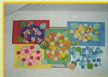
5月の制作活動「あじさい」

今年度4月より、午後の活動にも「力」をいれております。声を出すこと、体を動かすこと、頭を使うことと様々な活動を取り入れています。その中でも「こいのぼり」「あじさい」は、曜日毎に利用者の方々で職員と一緒に取り組んだ共同作品です。